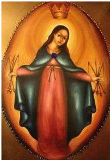
Matka Boska Łaskawa – Patronka Warszawy

Ukazanie się Maryi na polach pod Radzyminem spowodowało, że oddziały bolszewików w nieopisanym popłochu i panice rzuciły się do ucieczki. Czy oddziały polskie również widziały Matkę Boga?