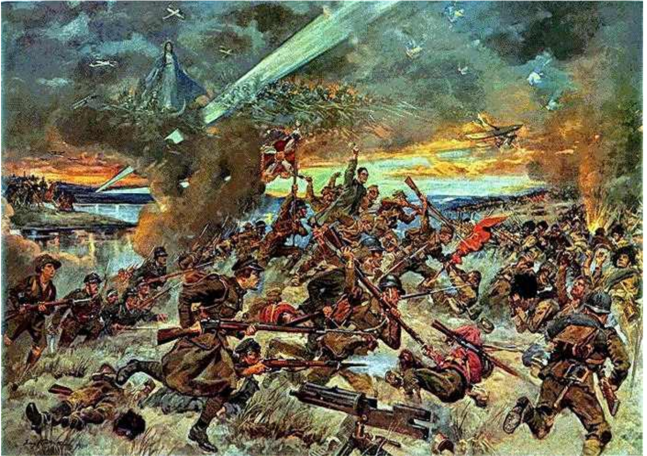
Jerzy Kossak „Cud nad Wisłą”

Z kolei za rządów ateistycznych w komunistycznej Polsce nie do pomyslenia było nawet wspomnianie o prawdziwym scenariuszu wydarzeń. Ukazanie się Matki Bożej widziane i relacjonowane przez naocznych świadków, sowieckich żołnierzy, było przez historyków reżimu zaszufladkowane jako przypadkowa gra świateł na niebie, pobożna maryjna legenda, wymysł grupki pobożnych pań, a najczęściej w oficjalnych przemówieniach komunistycznych władz – pomijane całkowitym milczeniem.