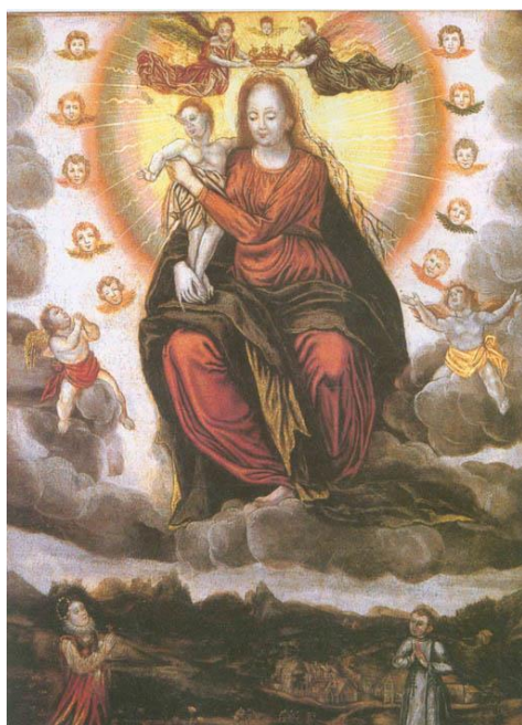
Matka Boska Łaskawa ze Lwowa (oryginał w skarbcu katedry wawelskiej, a tzw. wierna kopia w katedrze we Lwowie)