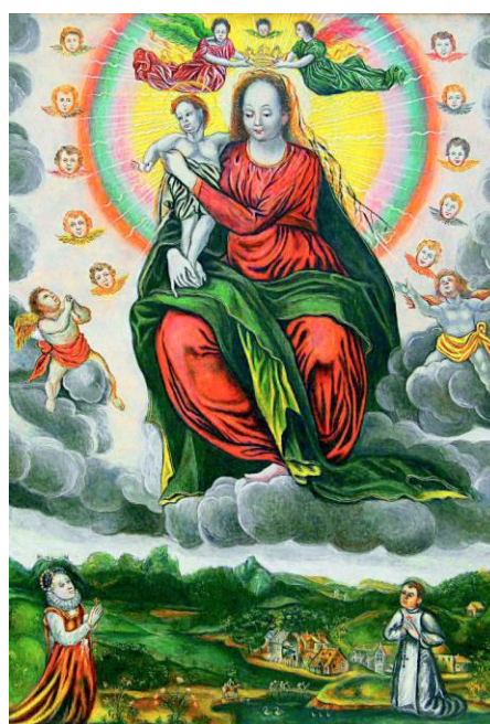
Matka Boska z katedry w Lubaczowie (tzw. wierna kopia obrazu ze Lwowa)

Król Jan Kazimierz bezzwłocznie udał się do tego miasta w towarzystwie dwóch chorągwi husarskich i w Katedrze Lwowskiej, przed obrazem Matki Bożej Łaskawej, 1 kwietnia 1656 r. w atmosferze powszechnego wzruszenia wiernych, otoczony biskupami i senatorami w obecności legata papieskiego, urzędowo i uroczysto ogłosił Maryję Królową Polski. Chwiejącą się na głowie ostatnich królów koronę przeniesiono na skronie Matki Zbawiciela. Wtedy to po raz pierwszy podczas publicznego odmawiania Litanii Loretańskiej przez nuncjusza papieskiego padło wezwanie: "Królowo Korony Polskiej".